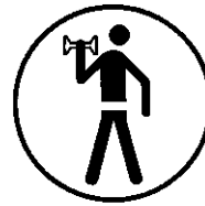
KRAFT & FITNESS